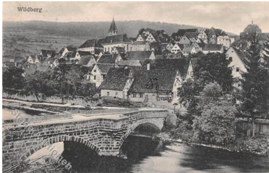
Abb. 1: Wildberg im Schwarzwald (Historische Postkarte)